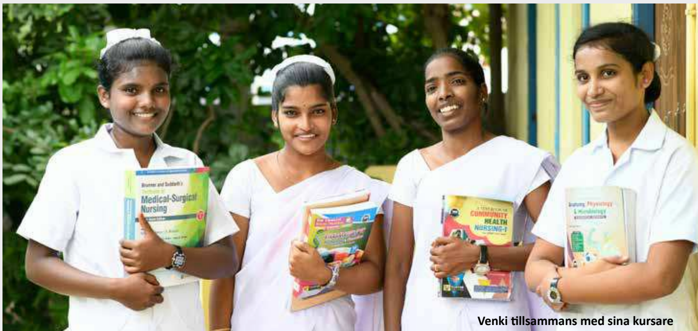
Venki tillsammans med sina kursare

meritbaserad plats på högskolan tilldelad av staten.