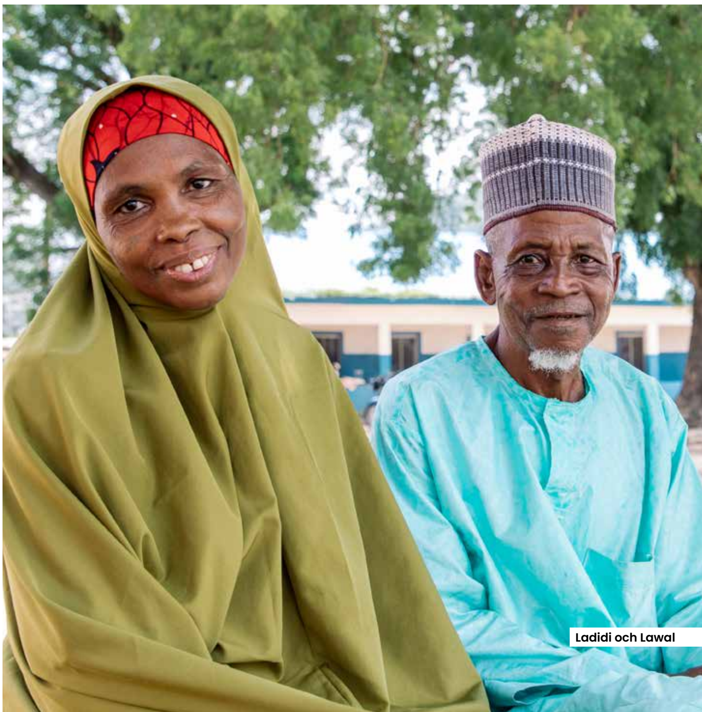
Ladidi och Lawal

hjälpigt, även om det inte så klart är som innan jag fick lepra. Folk transporterar ved till mig och jag säljer den vidare. Jag skulle vilja stärka mitt företag men det finns inget kapital. Utmaningarna tar aldrig slut och ofta har det med att jag har svårt